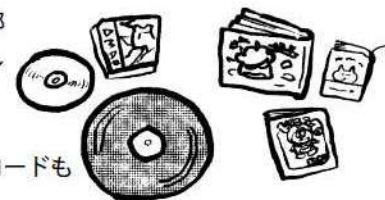
音楽CDやレコードも あります

本だけを目当てに寄る人も多いです。いつ自分にとって都合にいい本が入るかわかりません。ちよくちよく来てほしいです。