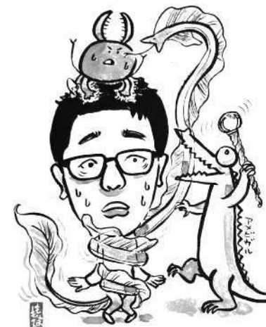
Aさんのオリジナルのモンスターたちと。