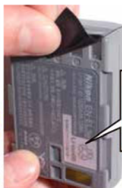
上リサイクルに出す際は端子部にテープを張って絶縁を（左）中村区の「エディオン名古屋本店」で電池コーナー近くのレジ横に設置されている小型充電式電池の回収ボックス

タルからできています。これらをリサイクルするため、電池メーカーや輸入業者などが「JBRC」という団体を設立。全国の家電量販店やホームセンター、自治体などと協力して会員メーカーが製造する使用済み小型充電式電池を店頭などで回収、再資源化事業者に引き渡して電池やステンレス製