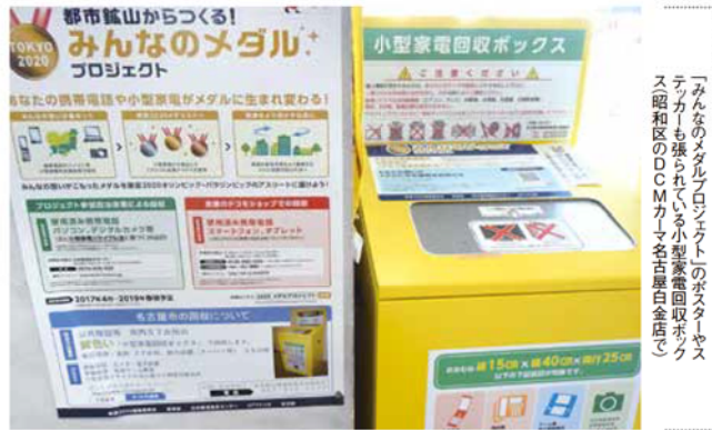
「みんなのメダルプロジェクト」のステッカーやステッカーも張られる小型家電回収ボックス(昭和区のDCMカーメ名古屋白金店)

メダルは国際オリンピック委員会(IOC)によって直径70~120mm、厚さ3~10mm、重さは