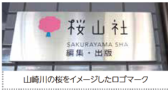
山崎川の桜をイメージしたロゴマーク

が増えてほしいです。(昭河区・主婦・47歳) エコトピ・プチヴェールの収穫体験。大切に育てた野菜を目で見て収穫できるなんて、とても素晴らしいことだと思います。自分でも野菜をつくってみたくなりました。(名東区・パート・47歳)