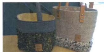
(右)手織りかばん(NO.488) 11,000円 (左)手織りかばん(NO.H752) 5,500円