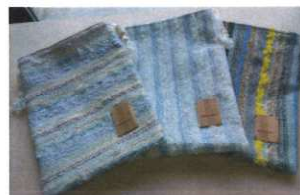
ショルダーバッグ各種 3,850円