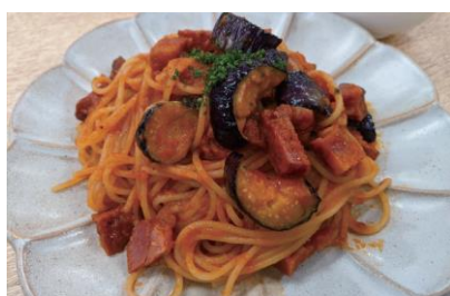
茄子とベーコンの トマトスパゲッティー ¥850