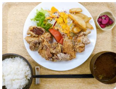
鶏の唐揚げ定食5個 ¥850 鶏の唐揚げ定食10個 ¥1300