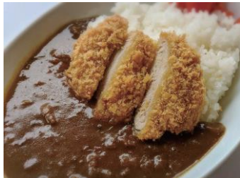
牛すじカレー ¥700 (ひれかつトッピング+220円)